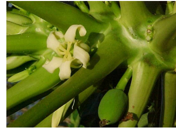
Papaya (Carica papaja)

Die Papaya stammt aus Südamerika. Heute ist sie jedoch in kultivierter Form in beinahe allen tropischen Ländern zu finden. Wahrscheinlich wurde sie von den Kolonisten vor knapp 200 Jahren nach Australien eingeführt. Die Papaya gehört zur Familie der Feigengewächse. Die bis zu 1 kg schweren gelben Früchte wachsen auf 6 bis 7 m hohen Bäumen. Blätter, Frucht und Schale sind reich an Vitaminen. Es existieren männliche und weibliche Bäume, wobei ein männlicher Baum genügt, bis zu 25 weibliche Bäume zu befruchten. Es gibt auch Bäume mit männlichen und weiblichen Blüten gleichzeitig.